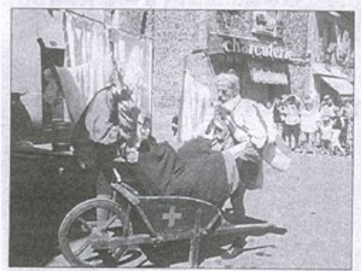
Des comédiens dignes de la comédia dell'arte investissent la place avec leurs charrettes pour 40 minutes de défilante parodie! Le public a été conquis par ces comédiens loufoques avec leurs drôles de théâtre, leurs drôles de répliques. Notre photo: Les urgences revues et corrigées par la troupe Machtiern

La Nouvelle République samedi 28 juillet 2007