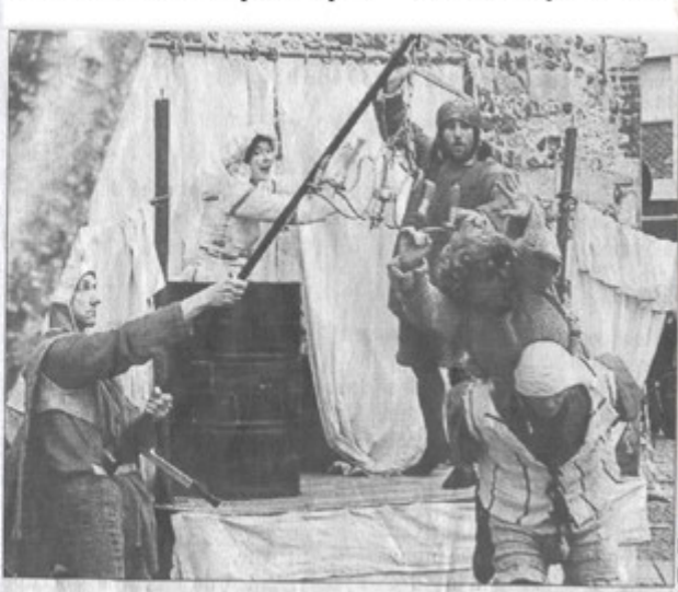
« Epiképok » un théâtre sur tréteaux qui s'amuse du Moyen Age.

La Nouvelle République samedi 28 juillet 2007