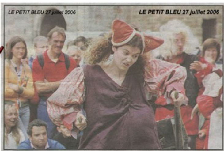
LE PETIT BLEU 27 juillet 2006 LE PETIT BLEU 27 juillet 2006 Le public a ri aux éclats avec "Epiképok" ou la Grande histoire du Moyen-Age, par la troupe Machtiern. Autrement dit, une version totalement déjantée avec une fille pas prude et des chevaliers pas valeureux.

Les Prataux - 35190 Saint-Thual Tél : 02 99 66 70 84 - 06 87 51 65 45 email : machtiern@wanadoo.fr contact diffusion : 06 88 25 53 09 machtiern.diffusion@orange.fr http://www.machtiern.org