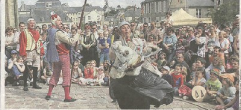
Hier, sur le parvis de la cathédrale de Bayeux, le public était réuni en masse pour assister à l'interprétation burlesque de l'histoire du chevalier du Marais.

La Compagnie Machtiern est soutenue depuis plusieurs années par le Conseil Régional de Bretagne par le Conseil Général d'Ille et Vilaine et par le Crédit Mutuel de Bretagne